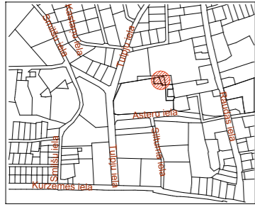
Objekta izvietojuma shēma